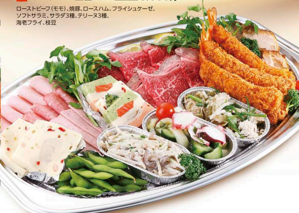
1 オードブル盛合せA 税抜価格 5,000円

ローストビーフ(モモ)、焼豚、ロースハム、フライシュケーズ、 ソフトサラミ、サラダ3種、テリーヌ3種、 海老フライ、枝豆