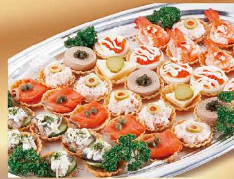
6 カナッペ盛合せ タルト(写真例) 税抜価格 5,000円 クラッカー 税抜価格 3,500円 いくら、玉子、サーモンマリネ、ずわいがに、 オイルサーディン、キャビア(タルトのみ)、レバーペースト

ローストビーフ(モモ)、焼豚、ロースハム、フライシュケーズ、 ソフトサラミ、サラダ3種、テリーヌ3種、 海老フライ、枝豆