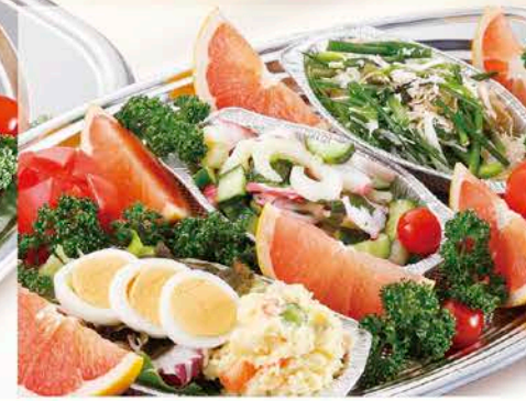
8 サラダの盛合せ 税抜価格 1,500円 サラダ3種とフルーツ