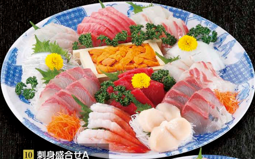
10 刺身盛合せA (5~6人前) 税抜価格 8,000円 中トロ、生うに、赤身、平目、真鯛、 かんぱち、ほたて、甘海老、いか

※季節により内容は多少異なります。(写真) ※全て使い捨て容器でお届けいたします。