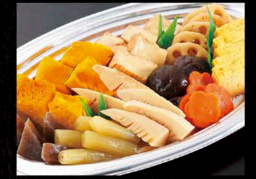
17 煮物盛合せ 税抜価格 2,500円 季節の煮物と玉子焼

※季節により内容は多少異なります。(写真) ※全て使い捨て容器でお届けいたします。