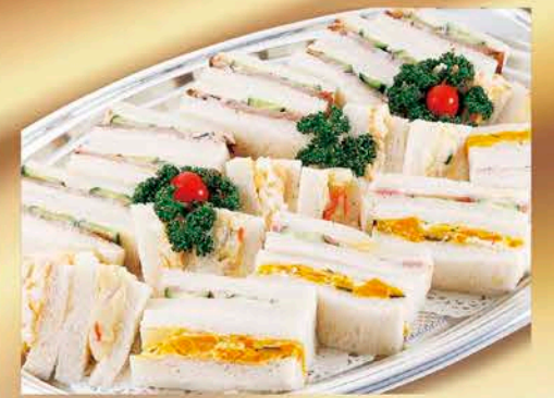
7 サンドイッチ 税抜価格 2,500円 ハムサンド、ミックスサンド、焼豚サンド