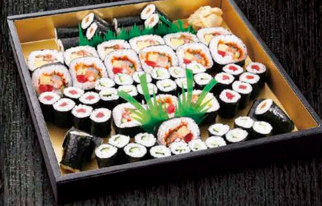
13 巻寿司盛合せ 税抜価格 2,500円 太巻: 海鮮巻、上太巻 細巻: 鉄火巻、かつ巻、かんぴょう巻