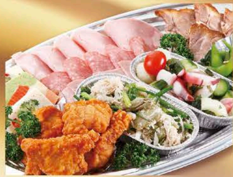
2 オードブル盛合せB 税抜価格 3,000円 ロースハム、フライシュケーズ、ソフトサラミ、焼豚、 サラダ2種、鶏ももの唐揚げ、枝豆

ホームパーティー、冠婚葬祭、学校行事などお祝いやおもてなし、仲間との集いの席に 和風・洋風、バラエティ豊富なメニューをお届けいたします。