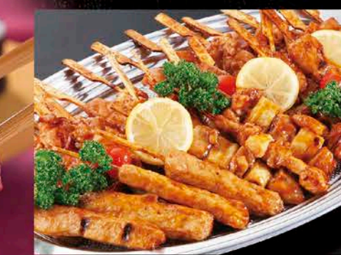
14 やきとり盛合せ 税抜価格 3,000円 もも、ねぎ間、つくね