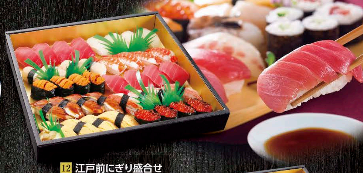
12 江戸前にぎり盛合せ 税抜価格 5,500円 中トロ、真鯛、ずわいがに、いくら、穴子、 海老、生うに、ほたて、玉子