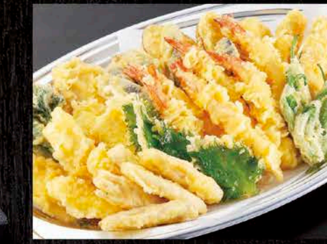
15 天ぷら盛合せ 税抜価格 2,500円 海老、かぼちゃ、茄子、いか、さつま芋など