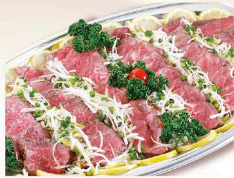
4 和牛ロースト盛合せ 税抜価格 5,000円