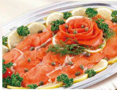
5 サーモンマリネ 税抜価格 2,500円