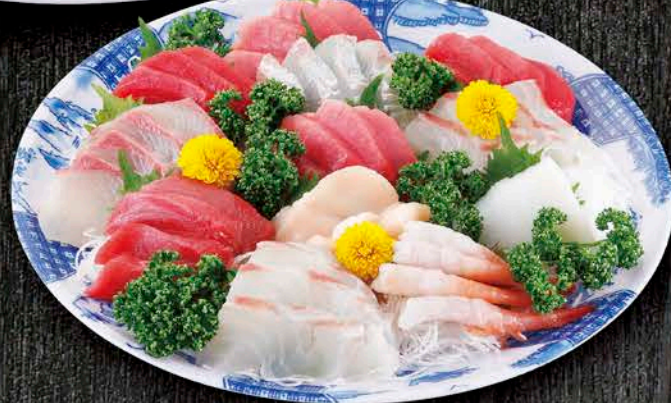
11 刺身盛合せB (3~4人前) 税抜価格 5,000円 中トロ、赤身、平目、真鯛、かんぱち、 ほたて、甘海老、いか