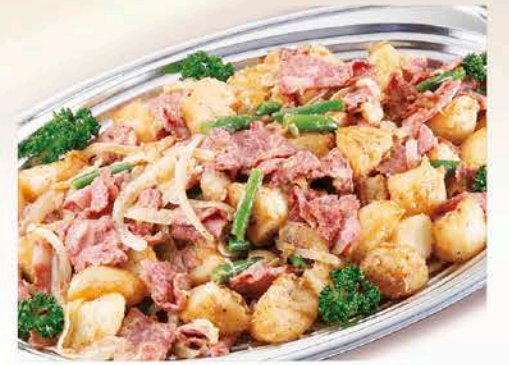
9 ジャーマンポテト 税抜価格 2,500円

※季節により内容は多少異なります。(写真) ※全て使い捨て容器でお届けいたします。