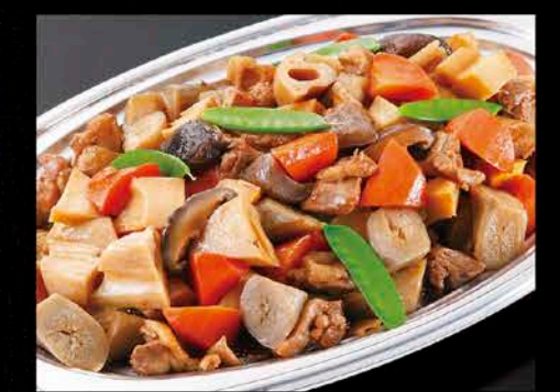
16 筑前煮 税抜価格 2,000円 鶏もも肉、竹の子、ごぼう、人参、椎茸、 こんにゃく、蓮根