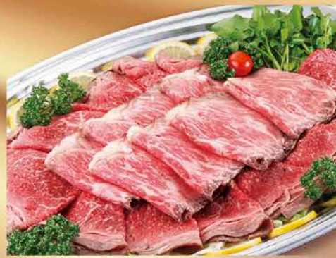
3 和牛ローストビーフ盛合せ ご予算に応じて盛り合せ致します。税抜価格 8,000円 ローストビーフ(モモ・サーロイン) (グレービーソース・レホール付)